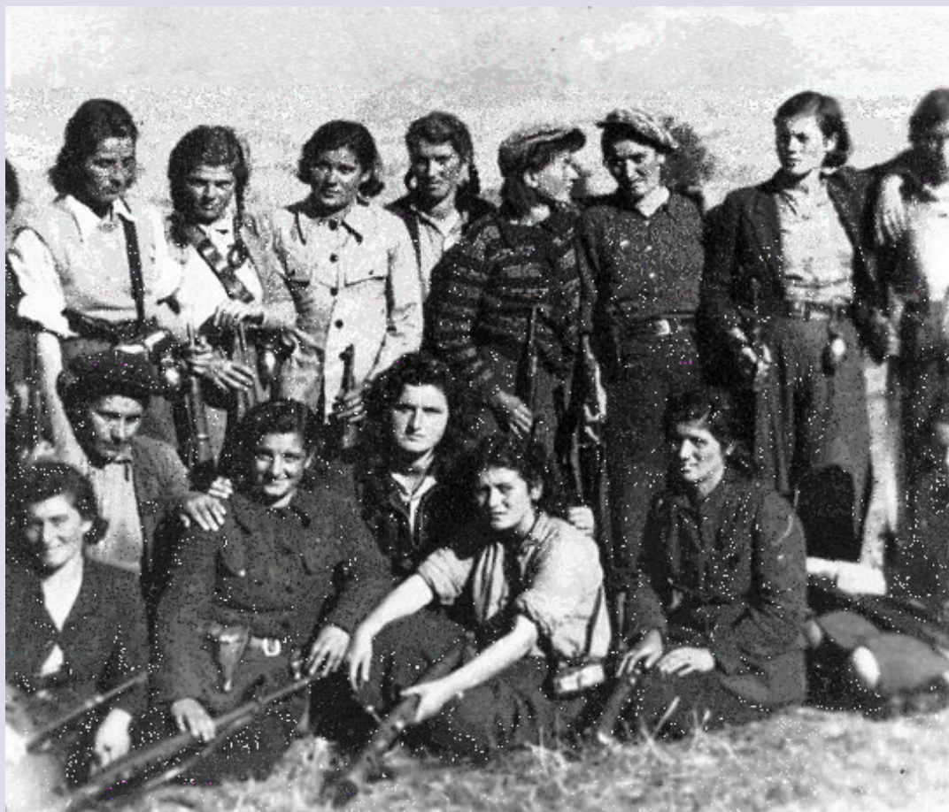
Muzej Istorije Jugoslavije, inv. br. 13699.